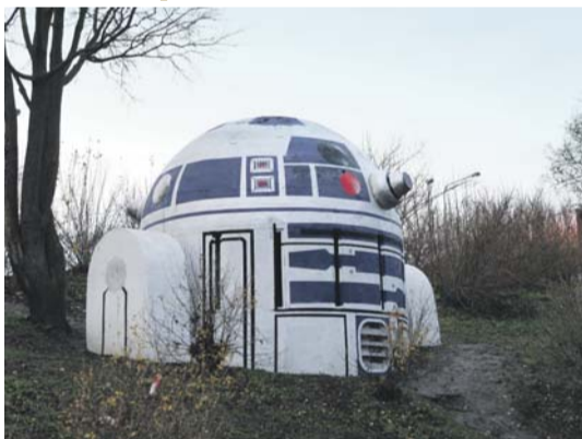
Modrobílý robot z Hvězdných válek; jedna z větracích šachet byla nečekaně vyzdobena neznámým tvůrcem.

„Velice nás těší, že kryt Folimanka přitahuje mladé i staré, historiky i kolemjdoucí, a doufáme, že odtud odcházejí poučení a s pocitem vděku, že nemusí kryt navštěvovat kvůli ohrožení válkou,“ uvedla k novodobé funkci bunkru Jana Černochová.