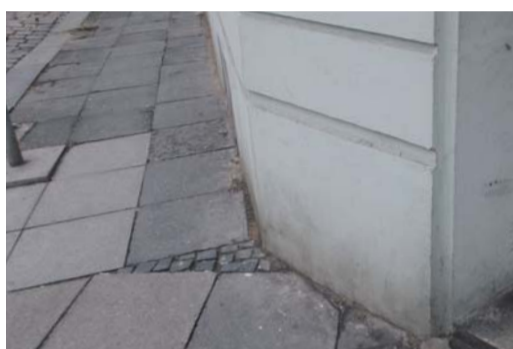
Chodník v ulici Vyšehradská před a po rekonstrukci