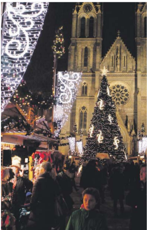
Vánoční trhy na náměstí Míru mají své kouzlo.

každý den do sedmé hodiny večerní. K období adventu ale patří i koncerty. Letos se konají 7., 14. a 21. prosince v kostele sv. Jana na Skalce, v Emauzích a u sv. Ludmily, o níž také vychází další brožura z edice kostely Prahy 2. Možná však máte spíše chuť potěšit své oči, pak si můžete vybrat z nabídky výstav a navštívit třeba tu s názvem Josef Čapek – vinohradský scénograf nebo se podívat na kresby čínským štětcem Pavla Turnovského ve Viničním altánu či zajít na retrospektivu Josefa Lady do Tančícího domu. Kdo si pospíší, stihne jistě návštěvu bunkru Folimanka a po ní ještě komentovanou prohlídku Gröbeho vily, obojí 16. prosince. Doufejme, že vám při tom nabitém programu, zbudě čas i na pečení cukroví a rozeslání vánočních pozdravů!