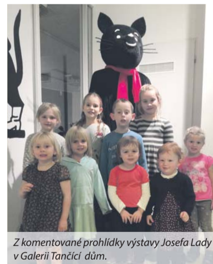
Z komentované prohlídky výstavy Josefa Lady v Galerii Tančící dům.

Nezapomeňte se také zapojit do projektu „Děti vítány“, o kterém píšeme více uvnitř novin na straně 3.