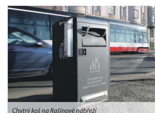
Chytrý koš na Rašínově nábřeží

ŽIVOTNÍ PROSTŘEDÍ Již brzy bude zahájen projekt „Chyťte na odpad v Praze 2“. Ten pomůže řešit problém s přeplněným otvorem do podzemních kontejnerů, bude sledovat stav kontejnerů a také zda není potřeba doplnit sáčky v koších na psi exkrementy.