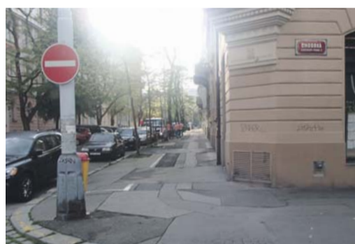
Chodník v ulici Moravská před a po rekonstrukci